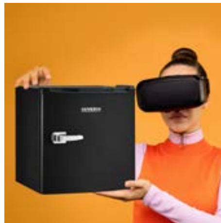
Frigo o Freezer retro