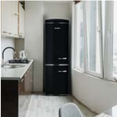
Frigoriferi combinato retro