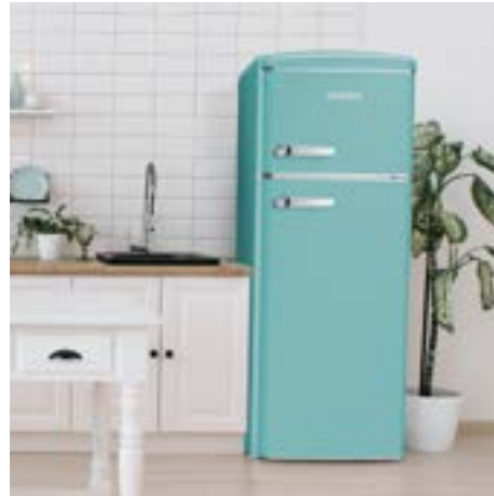
Frigoriferi doppia porta retro