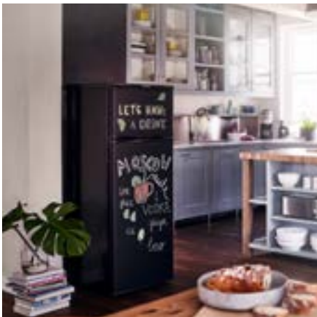
Frigoriferi doppia porta nero lavagna