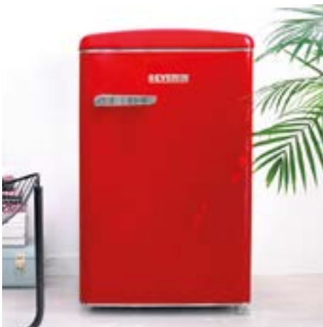
Frigoriferi sottotavolo retro